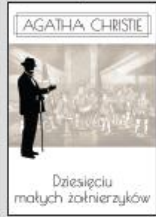
Okładki, s. 101-102 oraz 104

Tłumaczenie: Beata Kowalska, Agnieszka Polowinski. Tłumaczenie: Beata Kowalska, Agnieszka Polowinski. Tłumaczenie: Beata Kowalska, Agnieszka Polowinski.